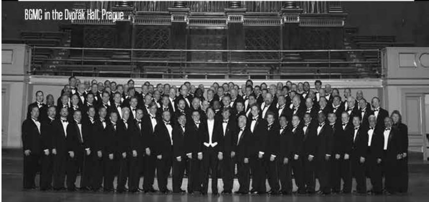
BGMC in the Dvůřák Hall, Prague

Today, we are prouder than ever to do it again.